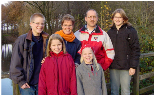
Een half jaar na terugkeer in Nederland